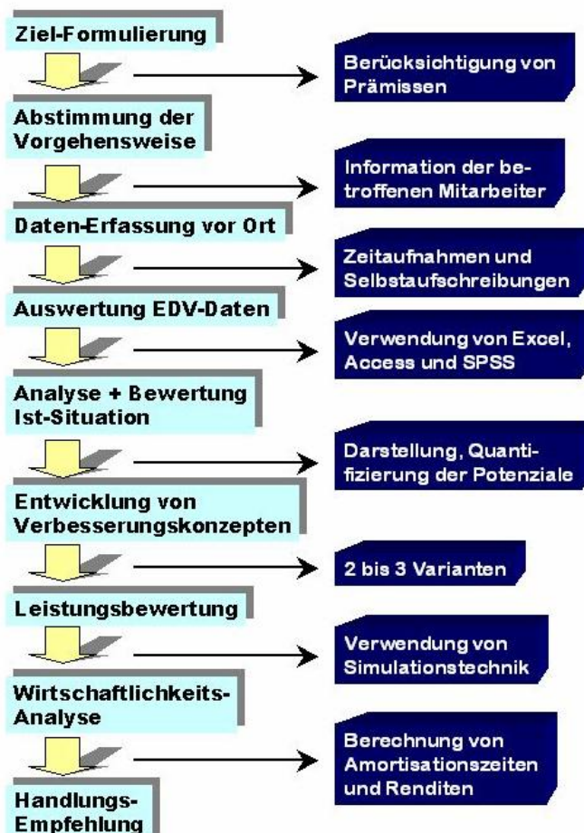
Abbildung 2: Haupt-Bestandteile der Projekt-Durchführung

Die Hauptschritte in der Vorgehensweise waren: